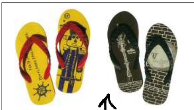
「横浜」をテーマにデザイン ビーチサンダル