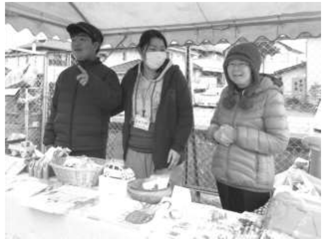
仲間たちの出店もがんばりました!