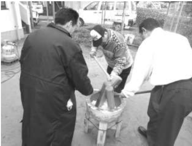
恒例のもちつきも行なわれました

バザー品をご提供いただきました皆様、ご来場いただきました皆様、バザーにボランティアで参加いただいた皆様、またバザー開催告知にご協力いただいた西日本新聞エリアセンター(樋井川・堤・長尾)様、本当にありがとうございました。