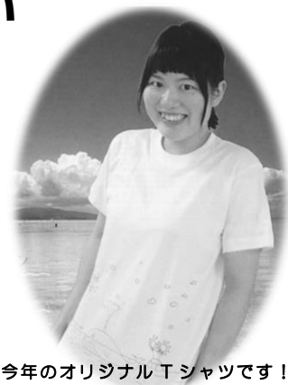
今年のオリジナルTシャツです！