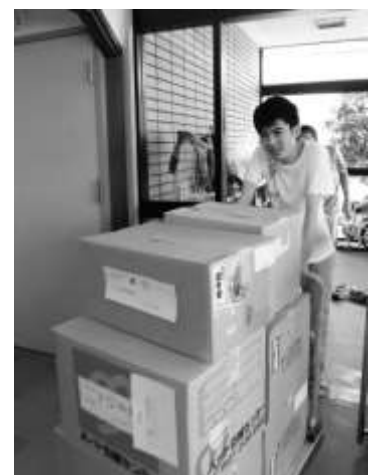
仲間も暑い中、がんばりました！