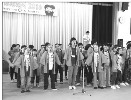
フィナーレは葦の家、えーる油山が一緒になって盛り上げました