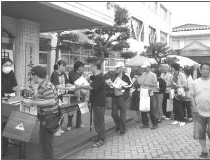
恒例の抽選会には長蛇の列ができました