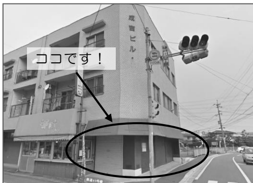
福岡市城南区樋井川6丁目4-11 成吉ビル1階

第2グループホーム建設に伴い、長年後援会の事務所、作業場として使ってきたスマイルハウスが取り壊されることになりました。