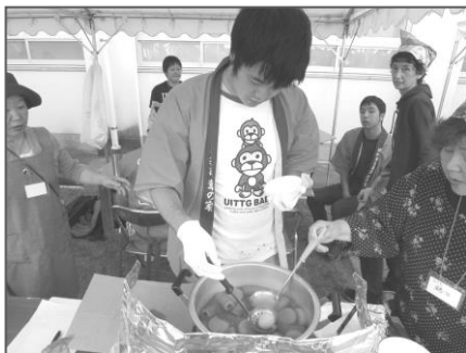
仲間のおでん販売も好評でした！