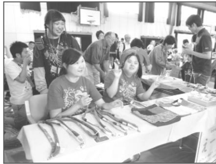
えーる油山、葦の家それぞれ出店し、売り上げも好調でした！