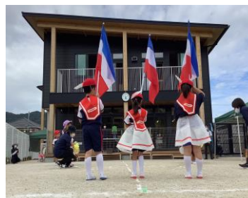
先日行われた運動会の様子です

〒814-0115 福岡市城南区東油山 1-10-74 092-400-1951(電話)